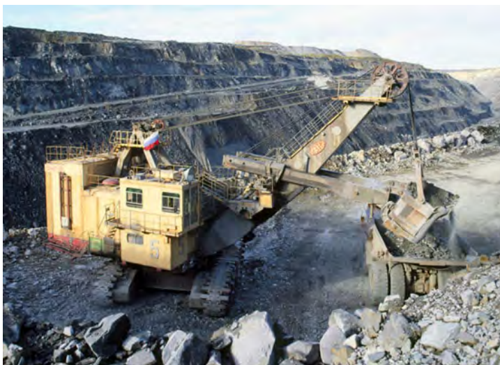
Рис. 2: Возможно, читатели этой книги никогда не видели карьерный экскаватор. Для примера приведем фотографию экскаватора ЭКГ-12 производства Уральского завода тяжелого машиностроения (УЗТМ). Ширина гусеницы этого экскаватора около двух метров, а в ковше без особого труда могут поместиться несколько бильярдных столов

число шаров и поломаешь огромное число столов! Представляется интуитивно вполне понятным, что в процессе измерения макроскопическим прибором любой микросистемы исходное (или начальное ) состояние микросистемы необратимо разрушается 7 . И микросистема случайным образом переходит в конечное состояние, которое, вообще говоря, должно зависеть от того, какая физическая характеристика микросистемы измерялась. Поэтому можно предпо-